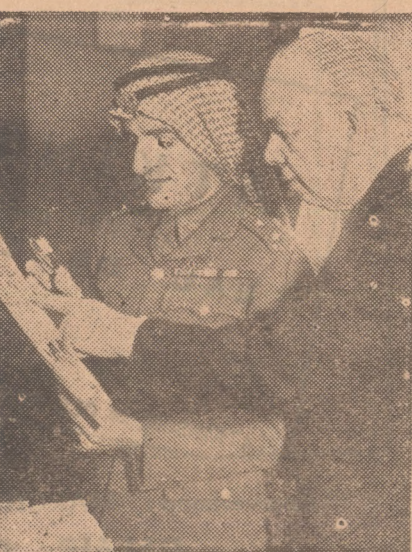
ARABIER VRAAGT UITLEG.